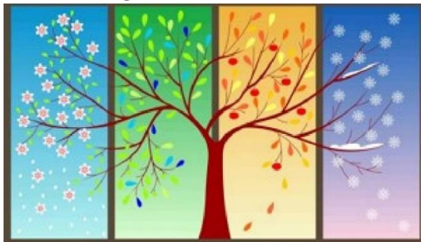
Hình ảnh miêu tả XUÂN – HẠ – THU – ĐÔNG

Các cháu mỗi người một vẻ. Xuân làm cho cây lá tươi tốt. Hạ cho trái ngọt, hoa thơm. Thu làm cho trời xanh cao, học sinh nhớ ngày tựu trường. Còn cháu Đông, ai mà ghét cháu được. Cháu có công ấp ủ mầm sống để Xuân về cây cối đâm chồi nảy lộc. Các cháu ai cũng đều có ích, ai cũng đều đáng yêu. Thế là từ đó các nàng tiên ai cũng vui vẻ. Không ai cảm thấy mình thua kém chị em của mình nữa. Họ say sưa đem tài năng của mình đi làm đẹp cho cuộc sống.