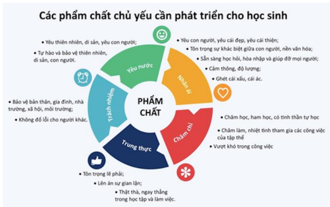
Hình. 5 phẩm chất trong chương trình phổ thông mới

Trong chương trình giáo dục phổ thông mới sẽ hình thành và phát triển cho học sinh 5 phẩm chất chủ yếu là yêu nước, nhân ái, chăm chỉ, trung thực, trách nhiệm.