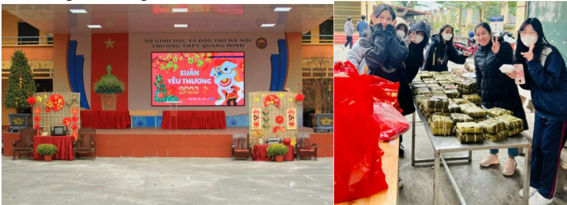
Hình ảnh trong lễ hội Bánh chưng truyền thống

Mục tiêu: Giúp học sinh hiểu được Tết cổ truyền dân tộc, phong tục gói bánh chưng ngày tết trên mâm cỗ thờ tết, thể hiện sự biết ơn trời đất đã cho mưa thuận gió hòa để mùa màng bội thu đem lại cuộc sống ấm no cho con người. Đồng thời bánh chưng còn làm quà biếu cho các bệnh nhân mắc bệnh hiểm nghèo điều trị tại bệnh viện đa khoa huyện Mê Linh trường THPT Quang Minh tổ chức hoạt động trải nghiệm gói bánh chưng là sân chơi để các em thể hiện tài năng và sự khéo léo của mình, tạo điều kiện để các em chia sẻ, hợp tác cùng các bạn. Giúp các em rèn luyện một số các kỹ năng cần thiết trong cuộc sống.